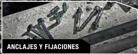
ANCLAJES Y FIJACIONES