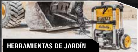
HERRAMIENTAS DE JARDÍN